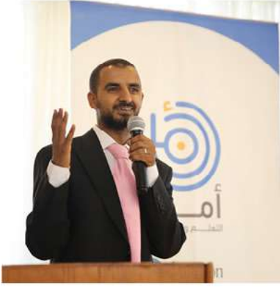
أحد خريجي البرنامج المتقدم

احتفلت جمعية وطنية بتخريج دفعات جديدة من مقدمي الرعاية من مركز أمان للتعليم والتطوير، حيث تم تخريج: